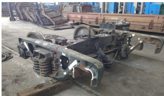
Рис. 4. Візок з встановленим обладнанням

Приклад візка дослідних вагонів на якому встановлені засоби вимірювальної техніки (рис 4) для запису даних які в подальшому будуть використані для оцінки показників руху дослідних вагонів.