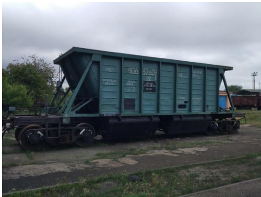
Рис. 1. Вагон-хопер моделі 19-923-01