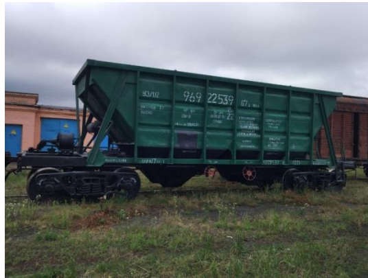
Рис. 2. Вагон-хопер моделі 11-715-01

Ходові динамічні випробування проводились фахівцями НВЦ філії «НДКТІ» АТ «Укрзалізниця» у порожньому стані в складі дослідного зчепу. Дослідний зчеп був сформований з: локомотива, дослідного вагона-хопера моделі 19-923-01, вагона-лабораторії, вагона-хопера моделі 11-715-01 (рис 3), на ділянці «Дарниця-Миронівка-Дарниця» Південно-Західної залізниці. Ділянка колії на якій проводились випробування за складом прямих і кривих ділянок, відповідає вимогам до колії для проведення ходових динамічних випробувань.