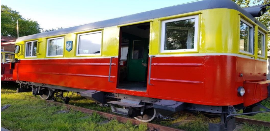
Рис. 1. Об'єкт випробувань – автодрезина АС1а

Аналіз останніх досліджень і постановка проблеми. На сьогоднішній день проблеми безпеки руху та визначення ресурсу несучих конструкцій рухомого складу, в тому числі спеціального рухомого складу, присвячена значна кількість наукових робіт.