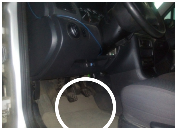
Рис. 1. Підключення OBD-сканера