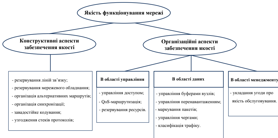
Рис. 1. Механізми забезпечення якості обслуговування

Серед основних з них треба відмітити метод управління доступом до ресурсів мережі шляхом контролю подання нових заявок, метод маркування пакетів відповідно до класу обслуговування, метод забезпечення вибору оптимального маршруту за параметром QoS, алгоритм своєчасного виявлення перенавантаження задля запобігання переповнення буферів у вузлах мережі, метод організації черг реалізований механізмом зваженої справедливої буферизації та механізмом буферизації за класом обслуговування, механізм укладання «Угоди про якість обслуговування» SLA, що дозволяє встановити однозначну відповідність між показниками якості зі сторони користувача та показниками функціонування мережі [4].