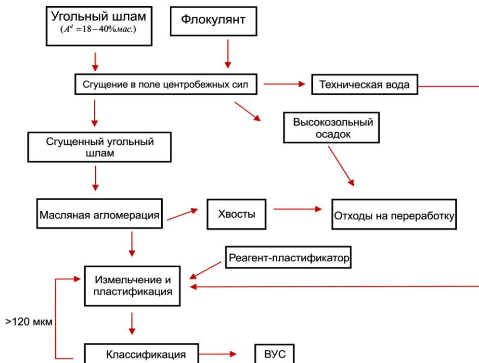
Рис. 1. Схема получения ВУТ на основе угольных шламов

мельницы, количество шаров или стержней, концентрация измельченного угля легко совместимы с распределением крупности частиц и необходимой энергии для дробления. Шаровые мельницы мокрого измельчения, являются не только измельчителями, но и эффективными перемешивающими устройствами.